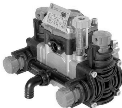
Рис. 3. Насос Bertolini POLY 2020.

4.5. Катушка (рис. 7) предназначена для намотки шланга и его перемещения к месту работы, а также для хранения шланга. Катушка состоит из рамки (поз. 1, 2) и барабана (3), посаженного на вращающуюся ось с рукояткой (5).