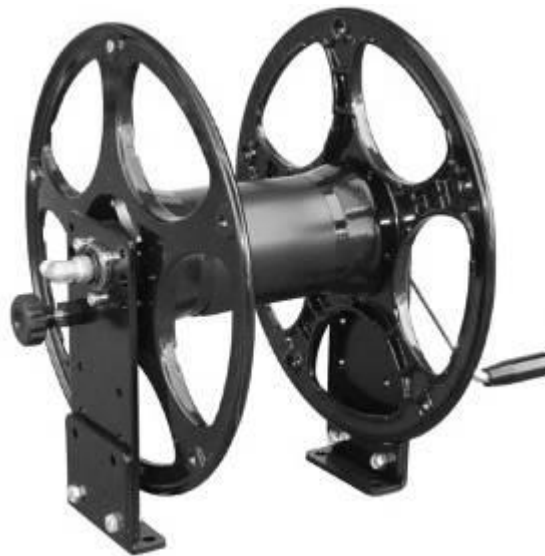
Рис. 7. КАТУШКА.

1. Ручка. 2. Штанга. 3. Распылитель. 4. Вариант специальной комплектации