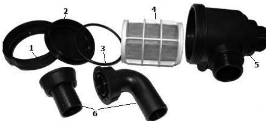
Рис. 5. Фильтр всасывающий.

1. Кольцо запорное. 2. Крышка фильтра. 3. Уплотнительное кольцо. 4. Фильтрующий элемент. 5. Корпус фильтра. 6. Патрубки.